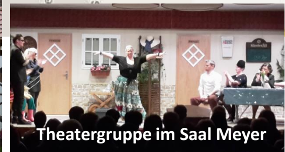
Theatergruppe im Saal Meyer