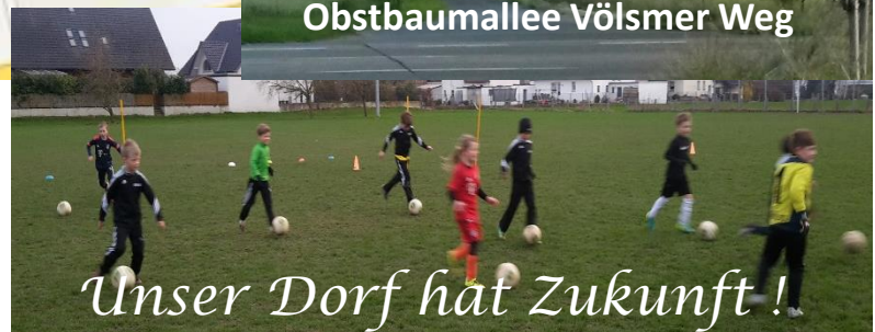
Unser Dorf hat Zukunft!