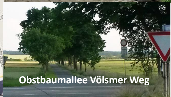
Obstbaumallee Völsmer Weg