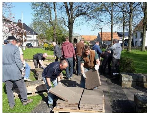
„Tortenstücke“ Musik- und Arbeitseinsätze im Kirchpark