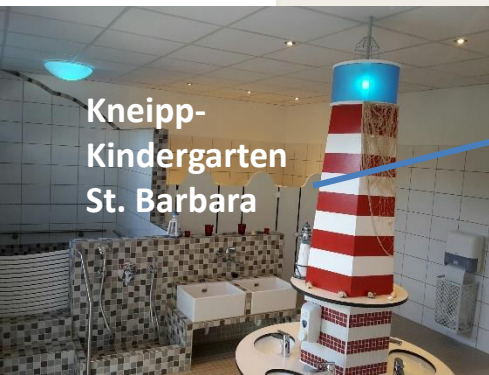
Kneipp- Kindergarten St. Barbara